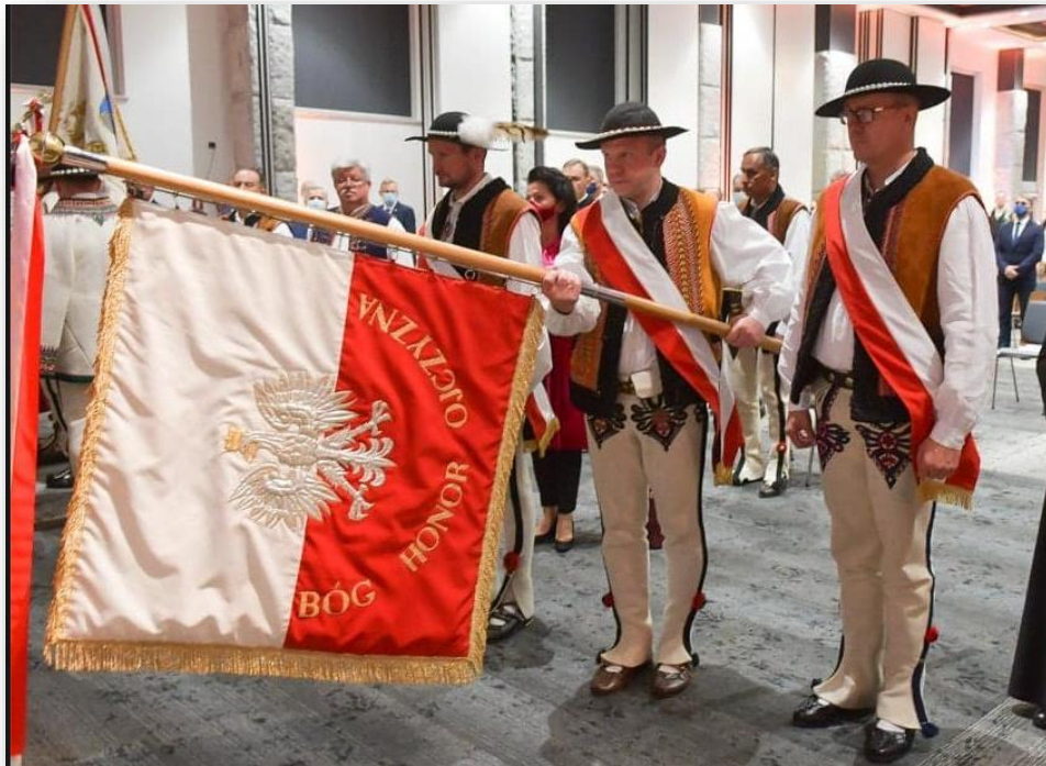
Sztandar Gminy Poronin