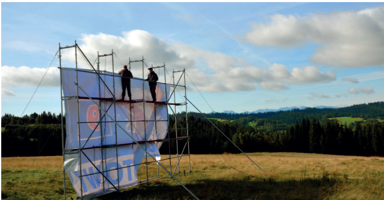
Ryc. 10. Jakość i miejsce stawiania reklam ma ogromny wpływ na postrzeganie krajobrazu

Współczesne działania w krajobrazie powinny go wzbogacać, nie niszczyć tego, co wartościowe i cenne dla społeczeństwa. Nasz współczesny wkład w dziedzictwo ukształtuje przestrzeń przekazywaną następnym pokoleniom i nie jest obojętne jaka ona będzie. Odrębność i piękno krajobrazu będące coraz bardziej poszukiwanym i cenionym dobrem wpływającym na jakość życia ludzi może być też szansą dla rozwoju wielu miejsc, również tych mniej znanych. Stąd rekomendacje audytu, wskazujące na potrzebę utrzymania charakteru zabudowy, nie oznaczają powielania historycznych wzorców i uczynienia z poszczególnych terenów rodzaju skansenu. Kierują one uwagę gmin w stronę kształtowania harmonii i porządku w wyodrębnionych przestrzeniach za pomocą odpowiednich ustaleń prawa miejscowego. Wskazują tereny, w których niepożądane jest wprowadzanie agresywnych, obcych w formie i stylistyce obiektów, zaburzających istniejący ład. Takich, które cechuje zachowana czytelność układu urbanistycznego i cech zabudowy, nie tylko w strukturach historycznych, ale również współczesnych.