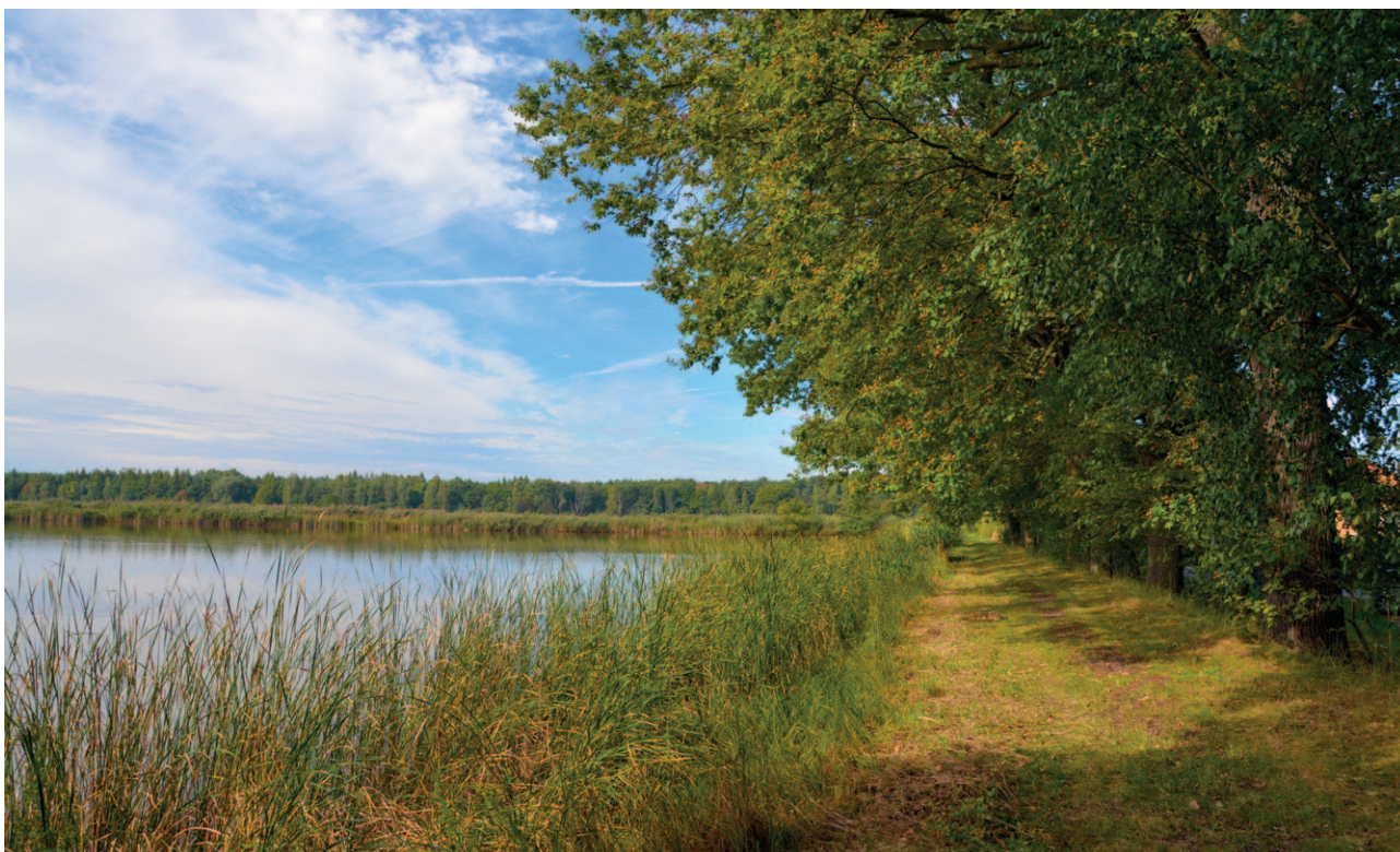
Ryc. 36. Proporcje elementów przyrodniczych decydują o postrzeganiu krajobrazu

dzie wiele zrobiono dla poprawy estetyki ich przestrzeni publicznych (rynki, plac), ale wielokrotnie zabudowa wokół nich pilnie wymaga działań rewitalizacyjnych. Problem w tym, że choć gminne ewidencje zabytków są bardzo obszerne (wręcz nadmiarowe), to zabytków w państwowym rejestrze prowadzonym przez Konserwatora Wojewódzkiego jest niewiele. Zabudowa mieszkaniowa z XIX i początków XX wieku jest praktycznie biorąc poza rejestr, co utrudnia jej ochronę i finansowanie konserwacji. Czas by rozszerzyć takie działania na kamienice i wille liczące po około 100 lat, tworzące indywidualny wyraz, wręcz budujące tożsamość poszczególnych miasteczek i miast. Znacznie trudniejsza jest sytuacja na terenach wiejskich, gdzie historycznej substancji prawie już nie ma, ale pozostały niezwykle cenne układy ruralistyczne, bardzo wyraziste w krajobrazie. Tam, gdzie jeszcze wartościowa architektura wiejska nie została zastąpiona nową zabudową, jej ochrona in situ jest nie lada wyzwaniem. Alternatywą byłoby tworzenie skansenów, choć z punktu widzenia ochrony krajobrazu kulturowego regionu jest to zdecydowanie gorsze rozwiązanie.