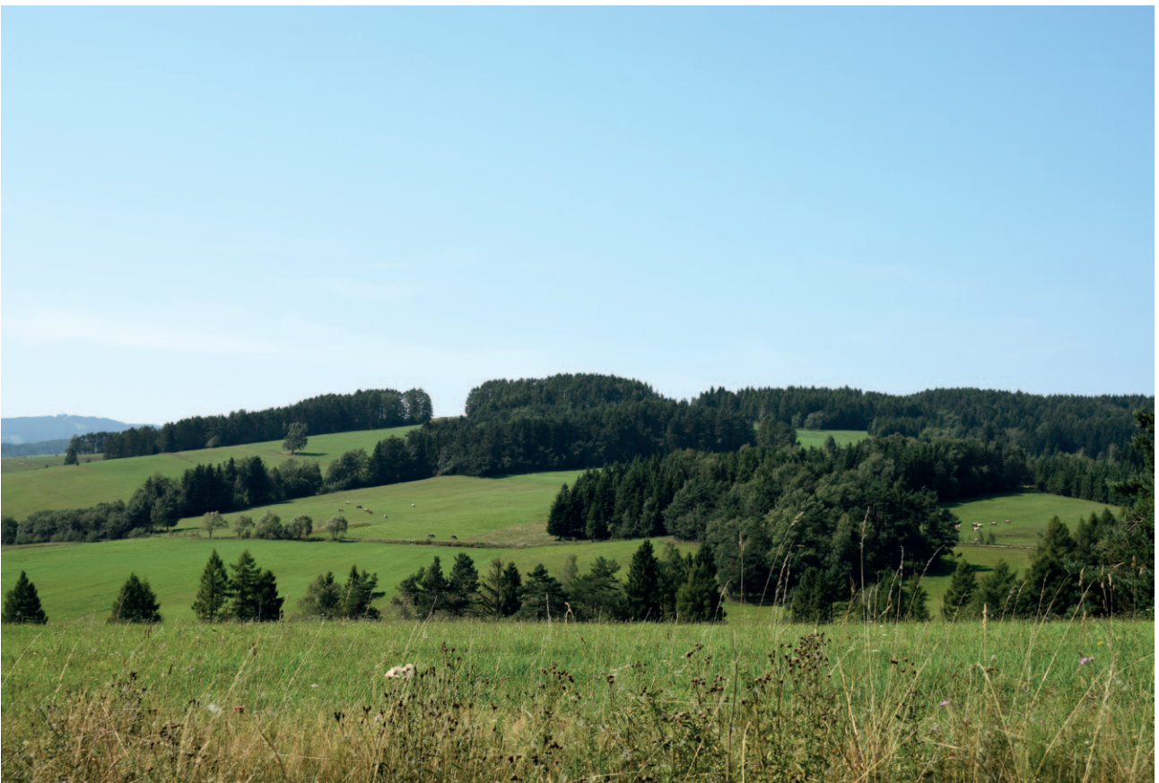
Ryc. 21. Unikalny krajobraz płytkiej doliny, zasługujący na ochronę