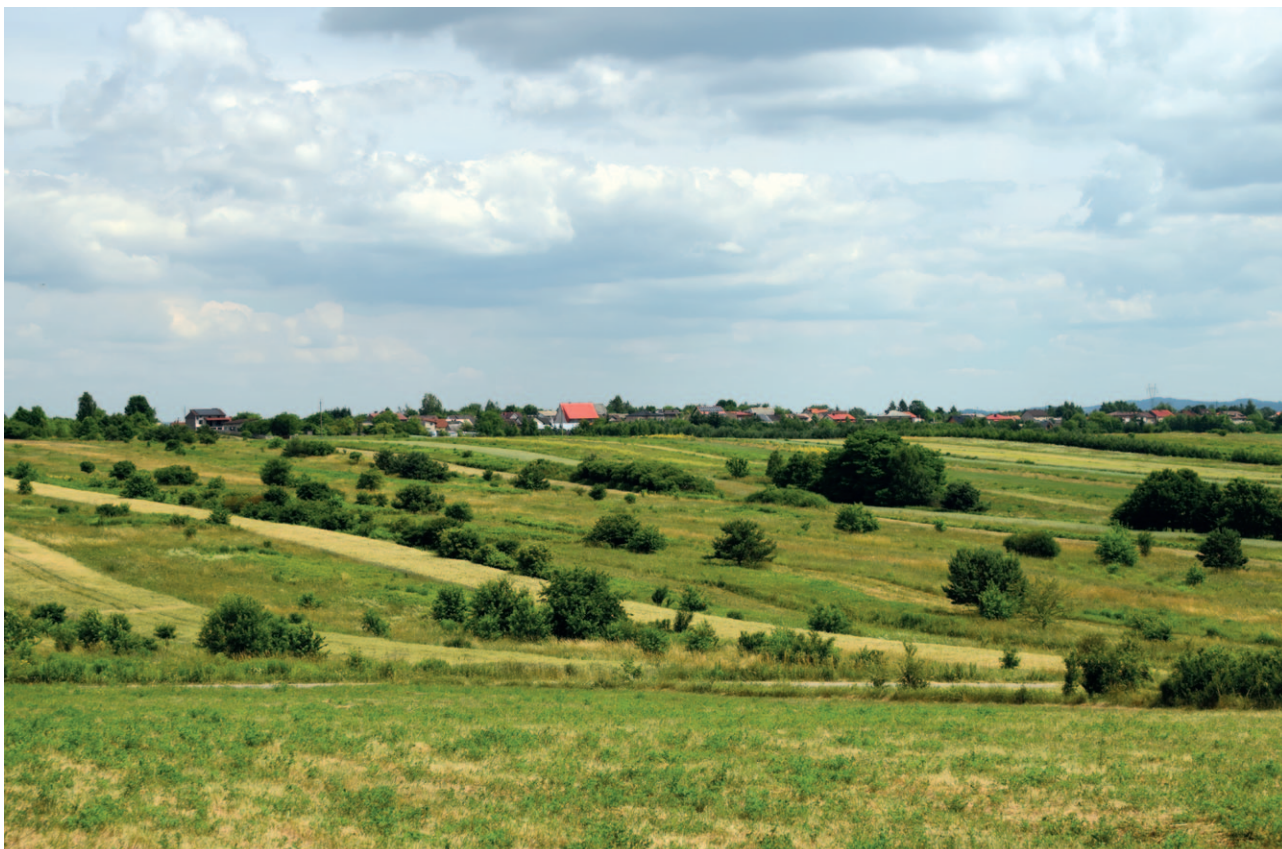
Ryc. 22. Zarastające pola

Mogą też mieć znaczący wpływ na charakter zmian krajobrazów wiejskich, w których harmonijnie przenikać się będzie gospodarcza działalność człowieka i naturalne procesy przyrodnicze. Tradycja i potencjał Małopolski w tym zakresie jest atutem, który powinien być dobrze wykorzystany w ramach projektów i działań związanych z polityką Zielonego Ładu.