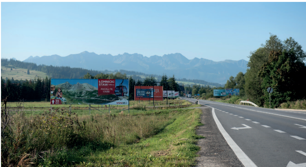
Ryc. 12. Zakłócony widok na Tatry