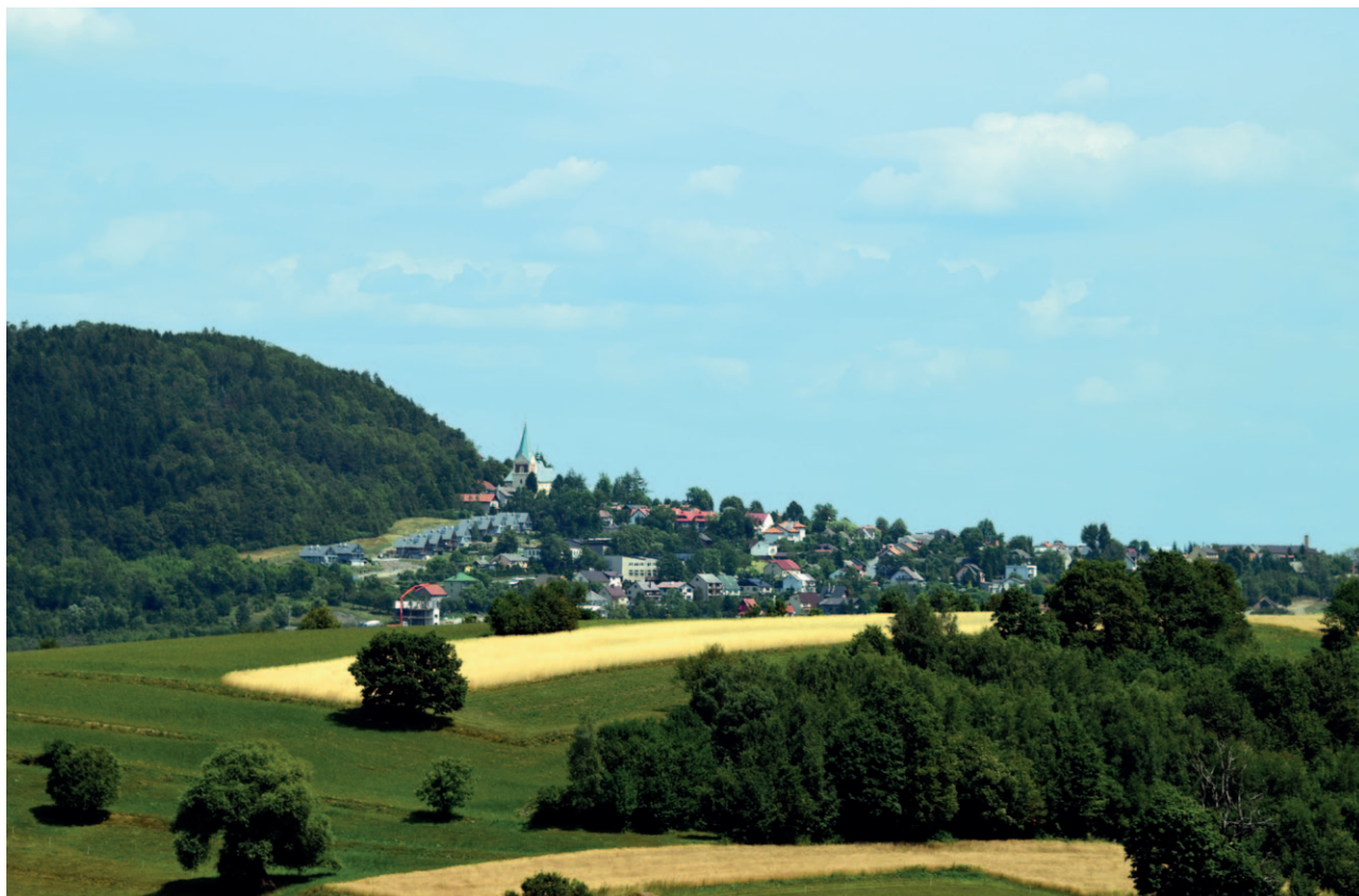
Ryc. 37. Przykład charakterystycznej sylwety małego miasta w Małopolsce

ciarska. Nie można także zapominać o wpływie światła, wynikającego z życia i funkcjonowania człowieka (oświetlenie ulic, osiedli, zakładów przemysłowych, etc.) na tzw „zaśmiecanie” krajobrazu nocnego, choć problem ten nie jest szeroko analizowany w ramach prac nad audytem.