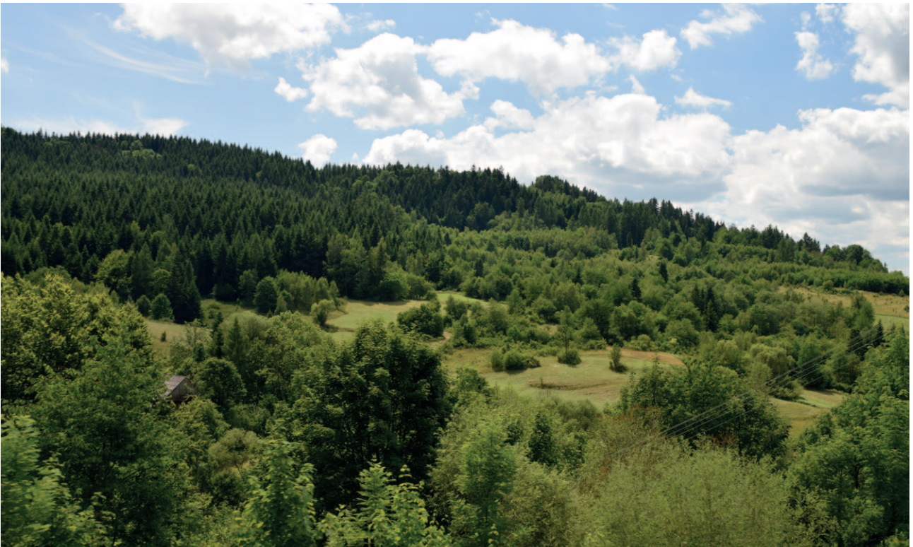
Ryc. 3. Przykład krajobrazu proponowanego do zalesienia