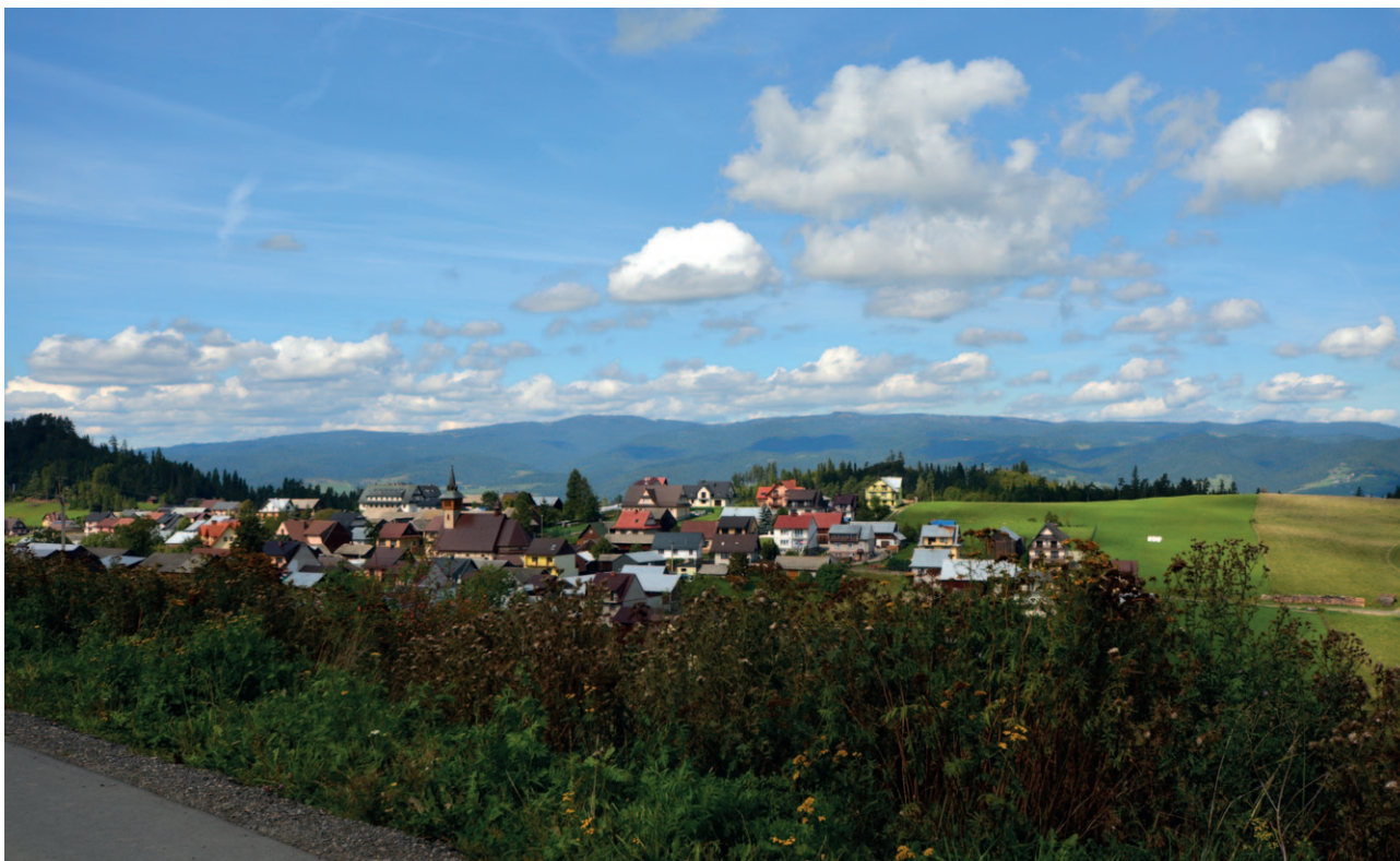
Ryc. 23. Przykład krajobrazu przyrodniczo-kulturowego nie objętego parkiem krajobrazowym