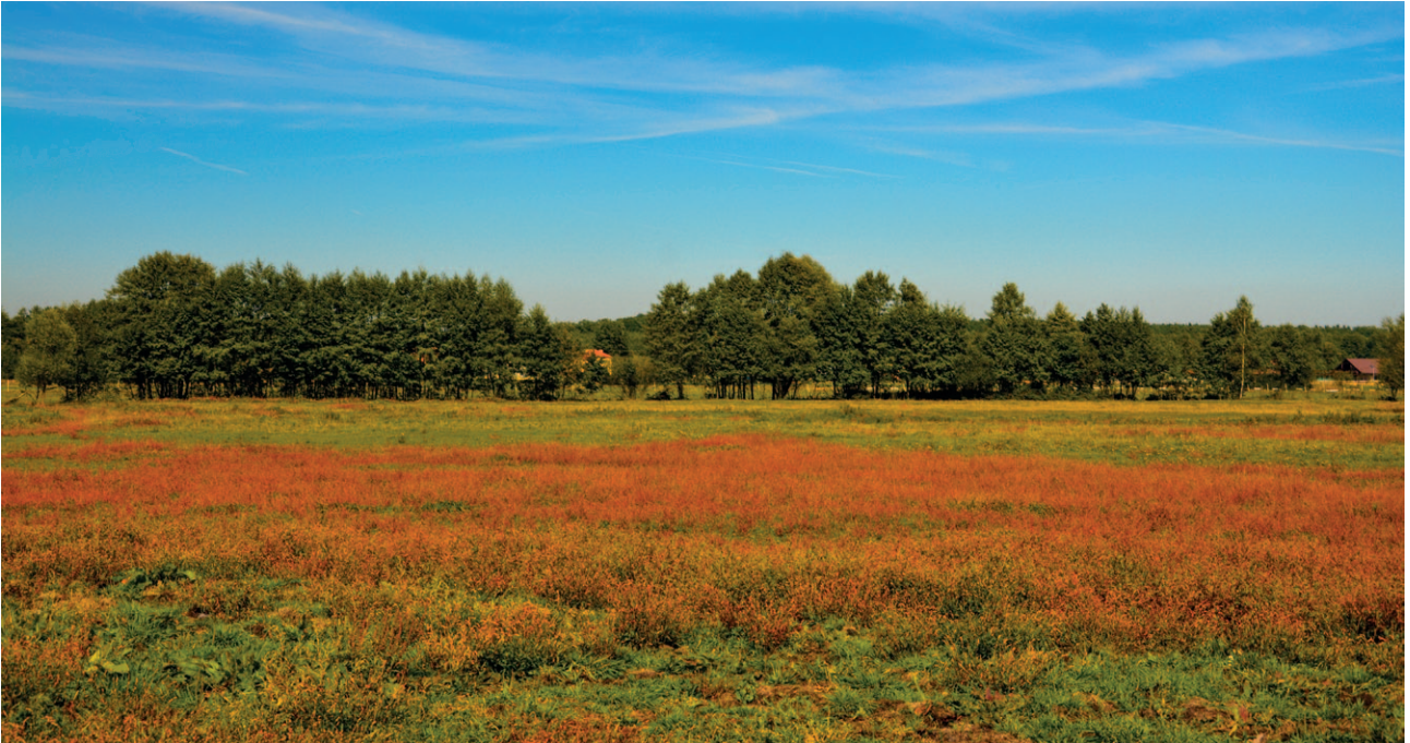
Ryc. 29. Krajobraz porolniczy Przedgórze Bocheńskiego