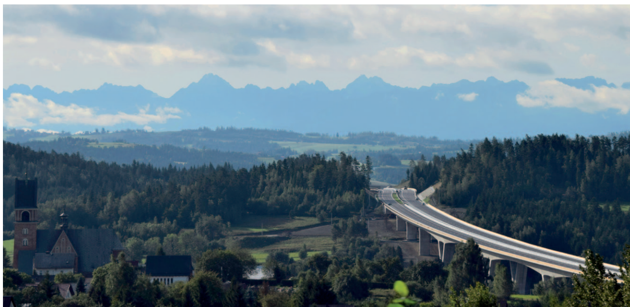
Ryc. 33. Dominujące w krajobrazie Małopolski są elementy infrastruktury drogowej