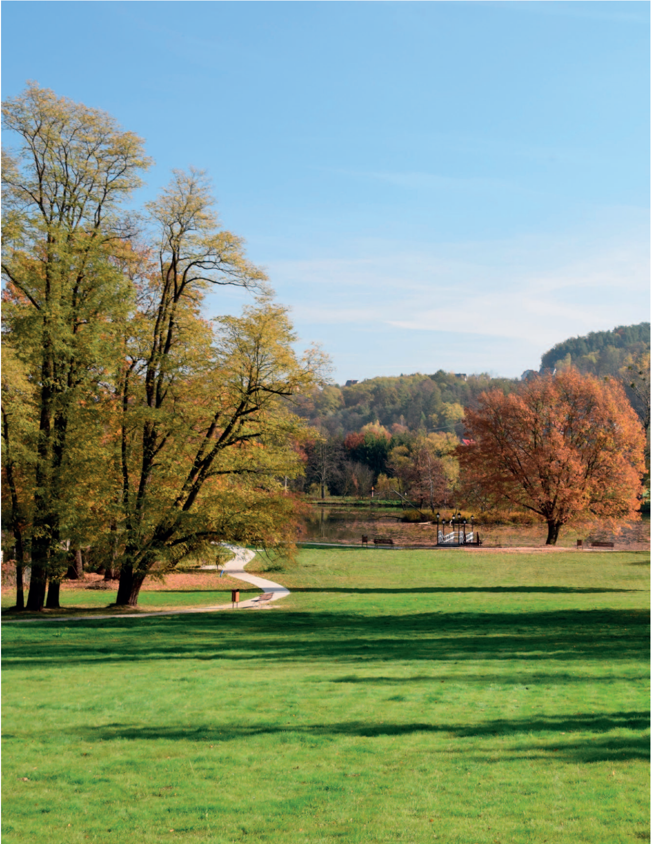
Ryc. 43. Zadbana przestrzeń publiczna