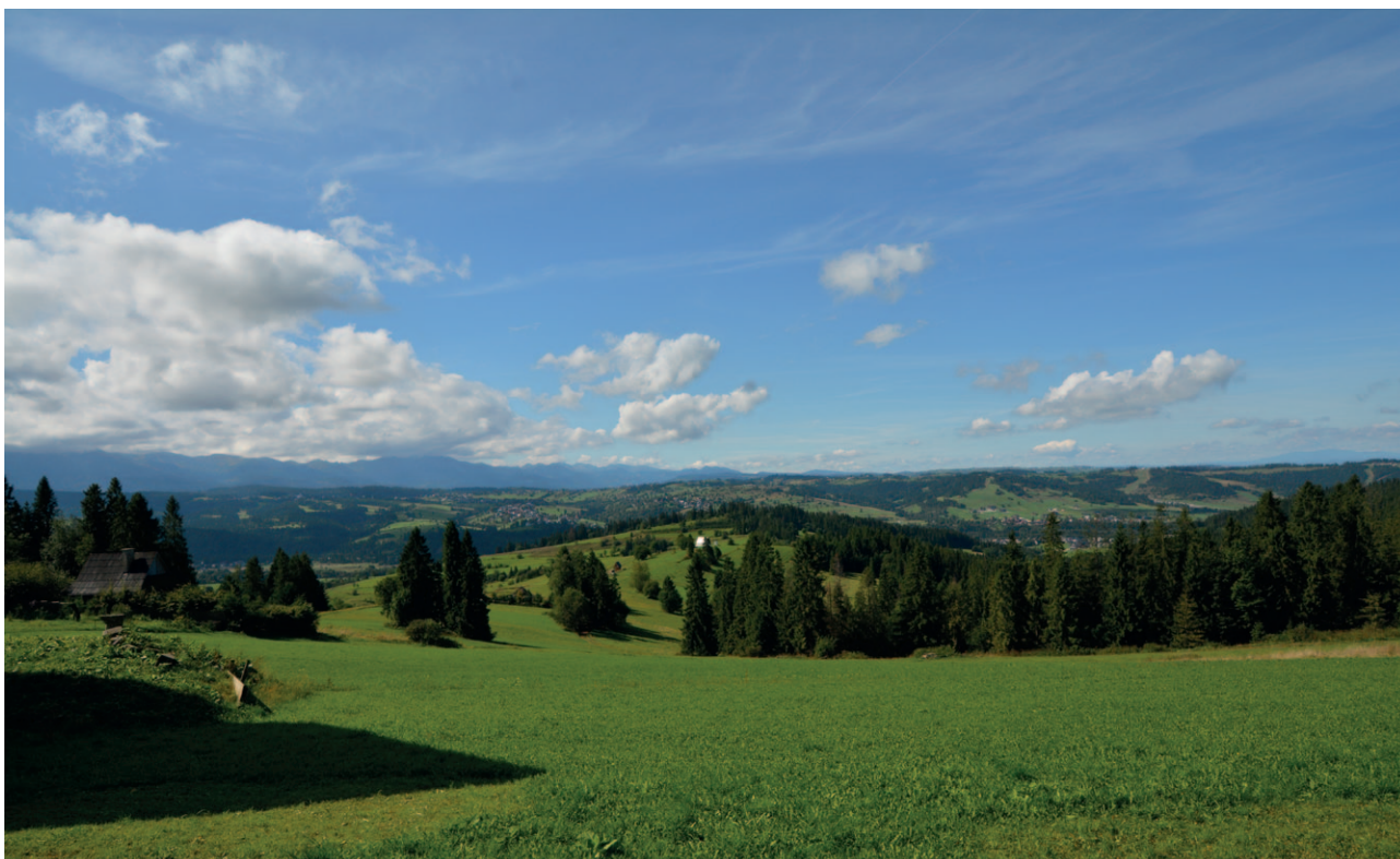
Ryc. 2. Panorama widokowa wzdłuż drogi lokalnej na Podhalu