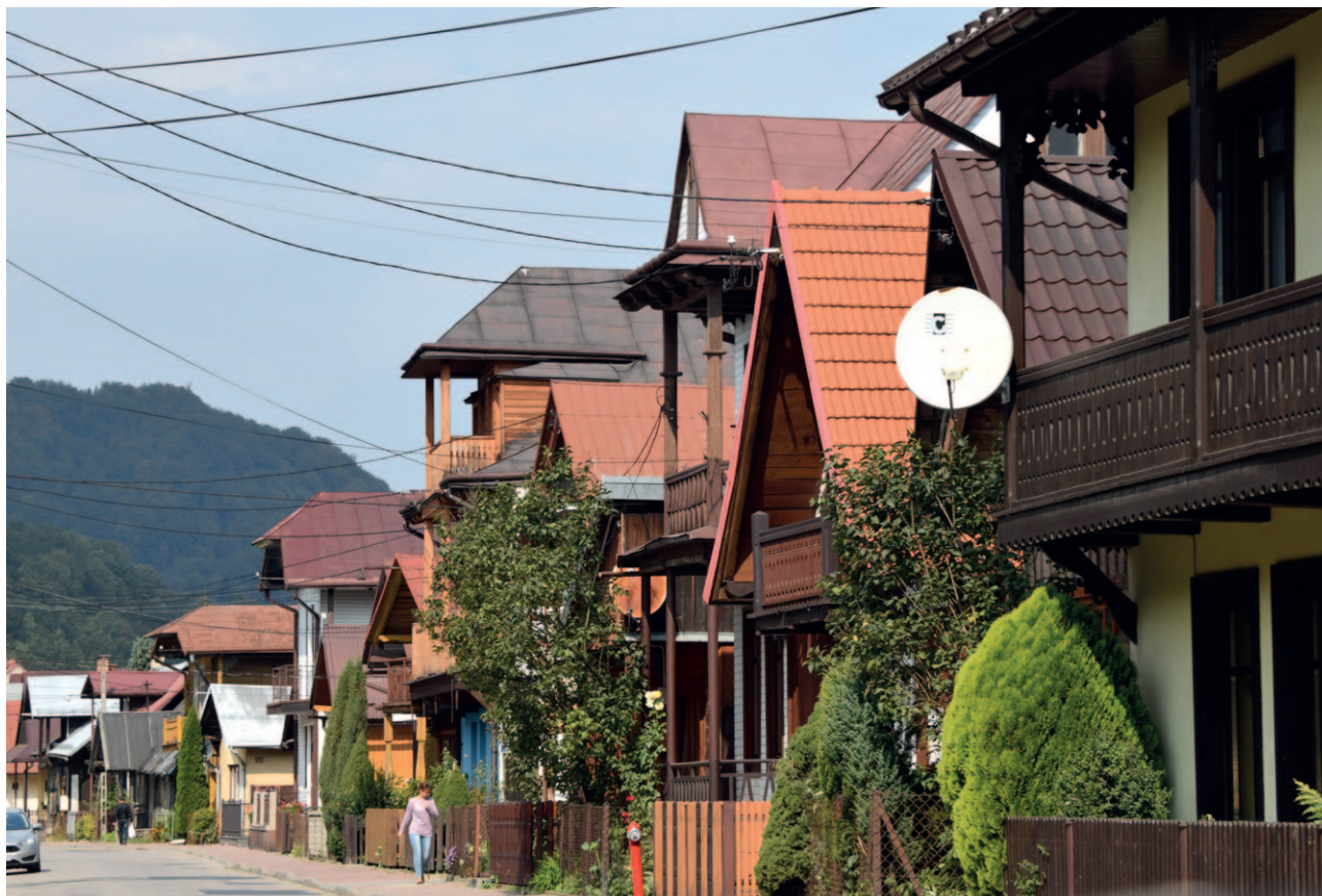
Ryc. 7. W takich miejscach warto zadbać o kontynuację charakteru nowej zabudowy

W ustaleniach audytu mogą być zawarte rekomendacje dotyczące proponowanych form prawa miejscowego, pozwalające gminom skutecznie chronić i świadomie kształtować szcze-