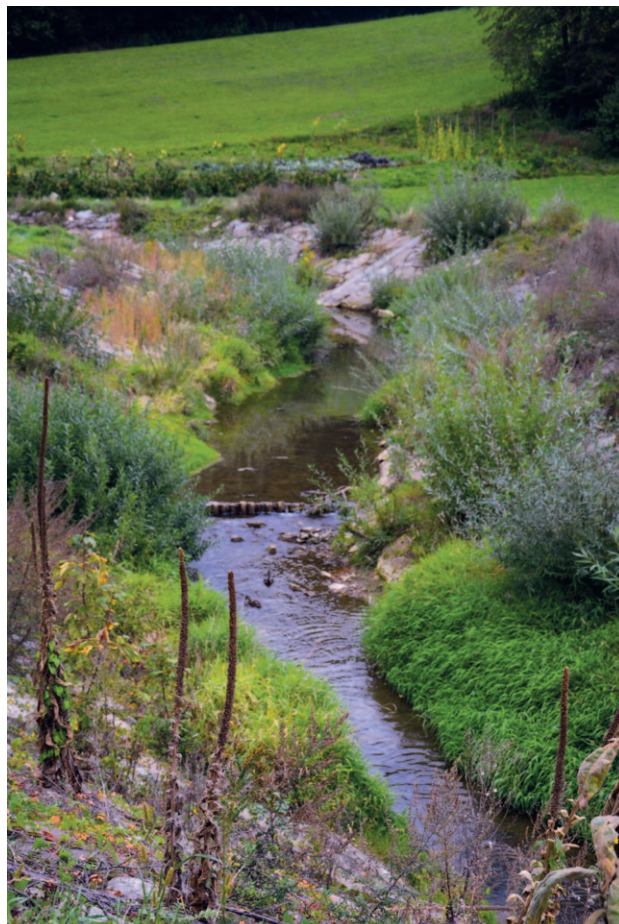
Ryc. 34. Pozytywny wpływ na krajobraz mają działania naturalizacji cieków wodnych

W tym kontekście zasadnym staje się postulat swoistego „uzupełnienia ogniw” w łańcuchu wielkopowierzchniowych obszarów chronionych,