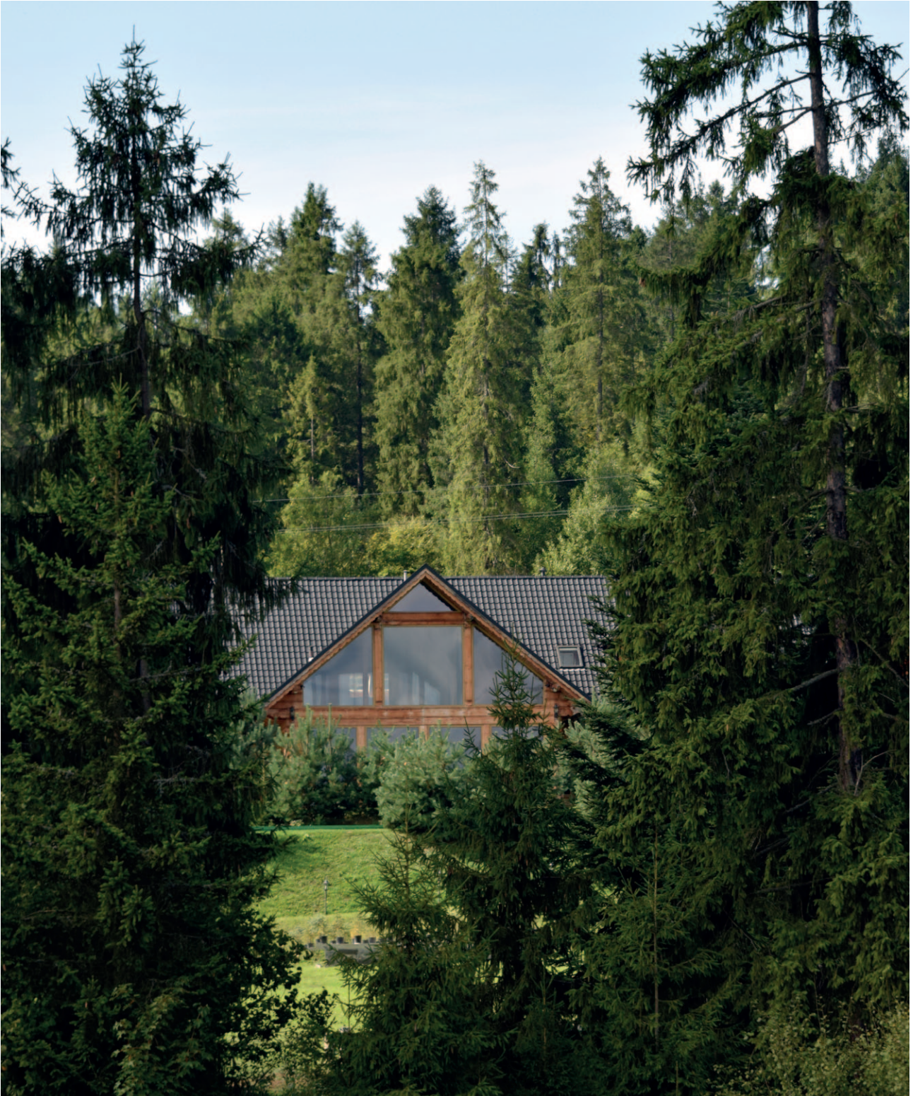
Ryc. 38. Rozpraszanie zabudowy nie musi odbywać się zawsze z negatywnym skutkiem dla krajobrazu

go i gminnego) i dotyczyć gruntowanych analiz wpływu planowanych dróg na jakość krajobrazu. Ponadto już teraz znakomicie widać jakie koszty funkcjonowania ponoszą gminy w zapewnieniu odpowiedniej infrastruktury i usług dla rozpraszającego się osadnictwa. Dojazd karetki, wywóz