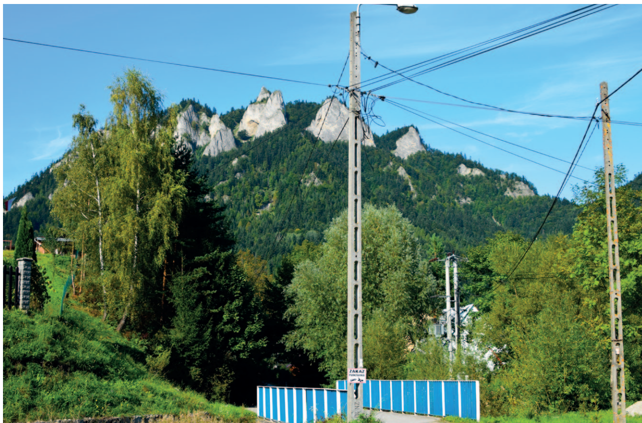
Ryc. 41. Widok na Trzy Korony z elementami sieci energetycznej