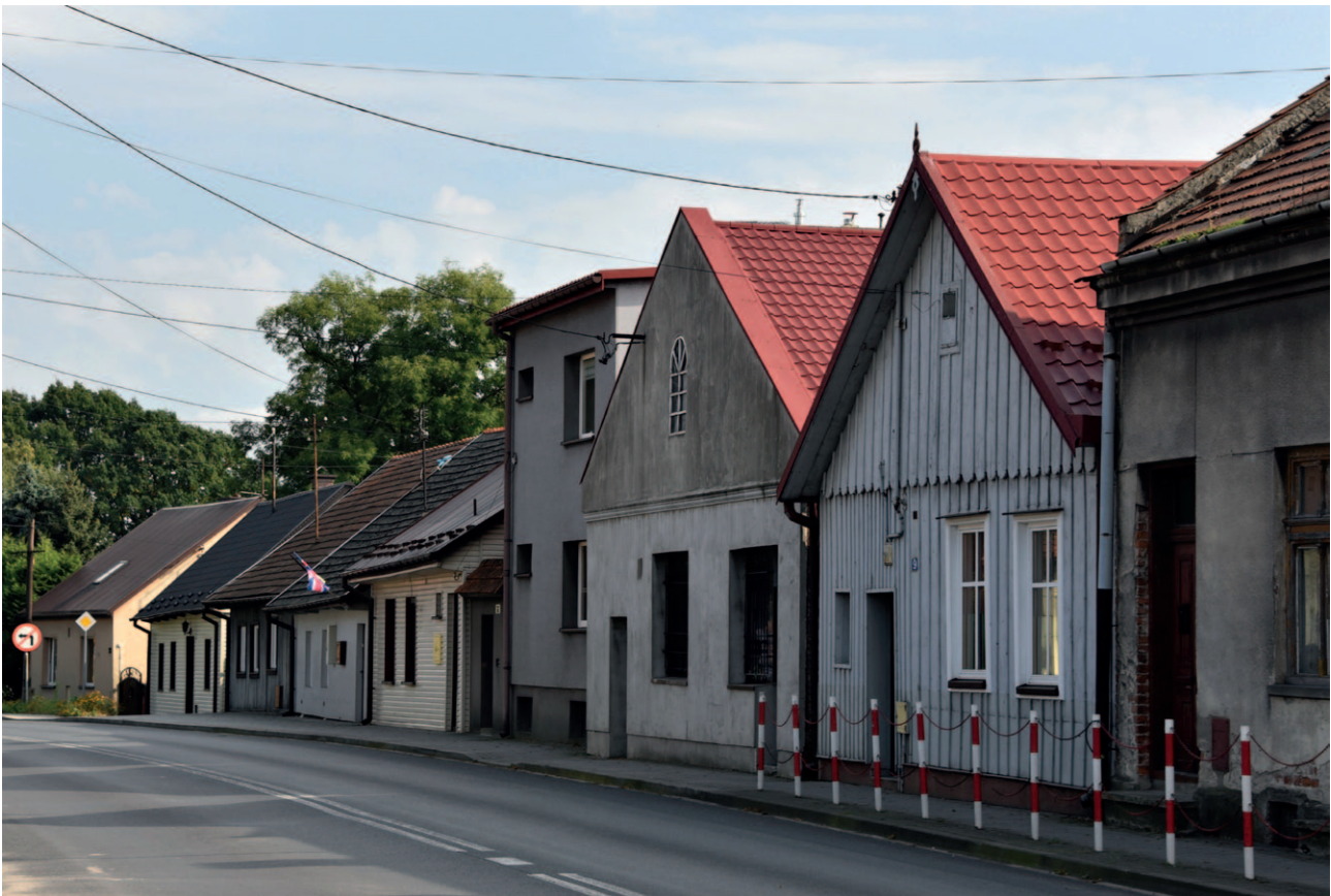
Ryc. 8. Zachowanie rytmu i formy zabudowy mogło być w tym przypadku bezproblemowe

W ustaleniach audytu zawarte będą rekomendacje wskazujące te obszary, na których uzasadnione jest utworzenie parku kulturowego. Dotyczyć to będzie miejsc, gdzie zachowany jest charakterystyczny dla miejscowej tradycji, krajobraz kulturowy. Miejsc, w których zabytki i obiekty historyczne powinny otrzymać ochronę otaczającej je przestrzeni, odpowiednią ekspozycję i urządzone sąsiedztwo. Te szczególne obszary winny być przede wszystkim chronione przed przypadkowymi zmianami niszczącymi ich charakter oraz przed nieuporządkowanym wykorzystywaniem przestrzeni publicznej. Obejmą one, zachowane w miastach i wsiach, układy urbani-