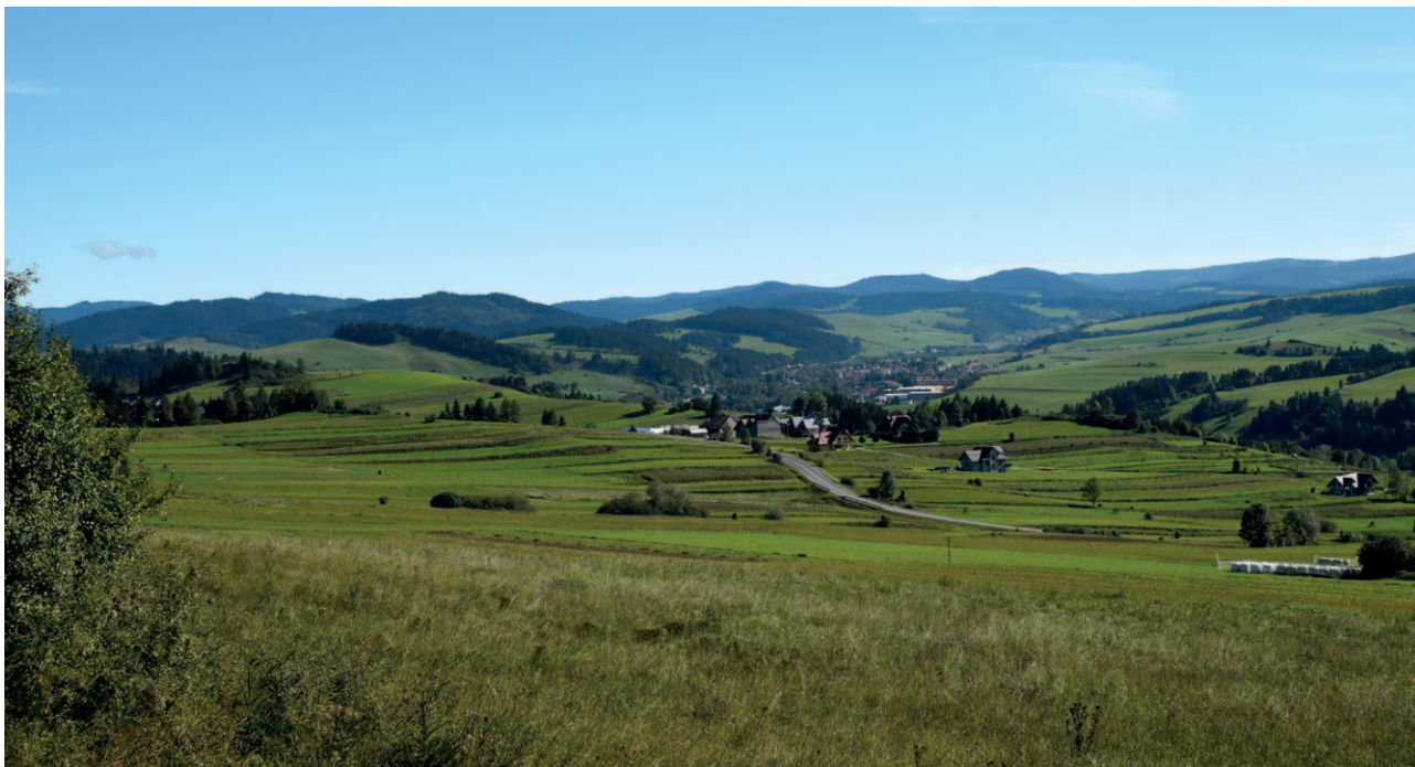
Ryc. 15. Wyraźny układ zabudowy skupionej w dolinie tworzy harmonijny krajobraz, choć dostrzec można pierwsze oznaki jej rozpraszania