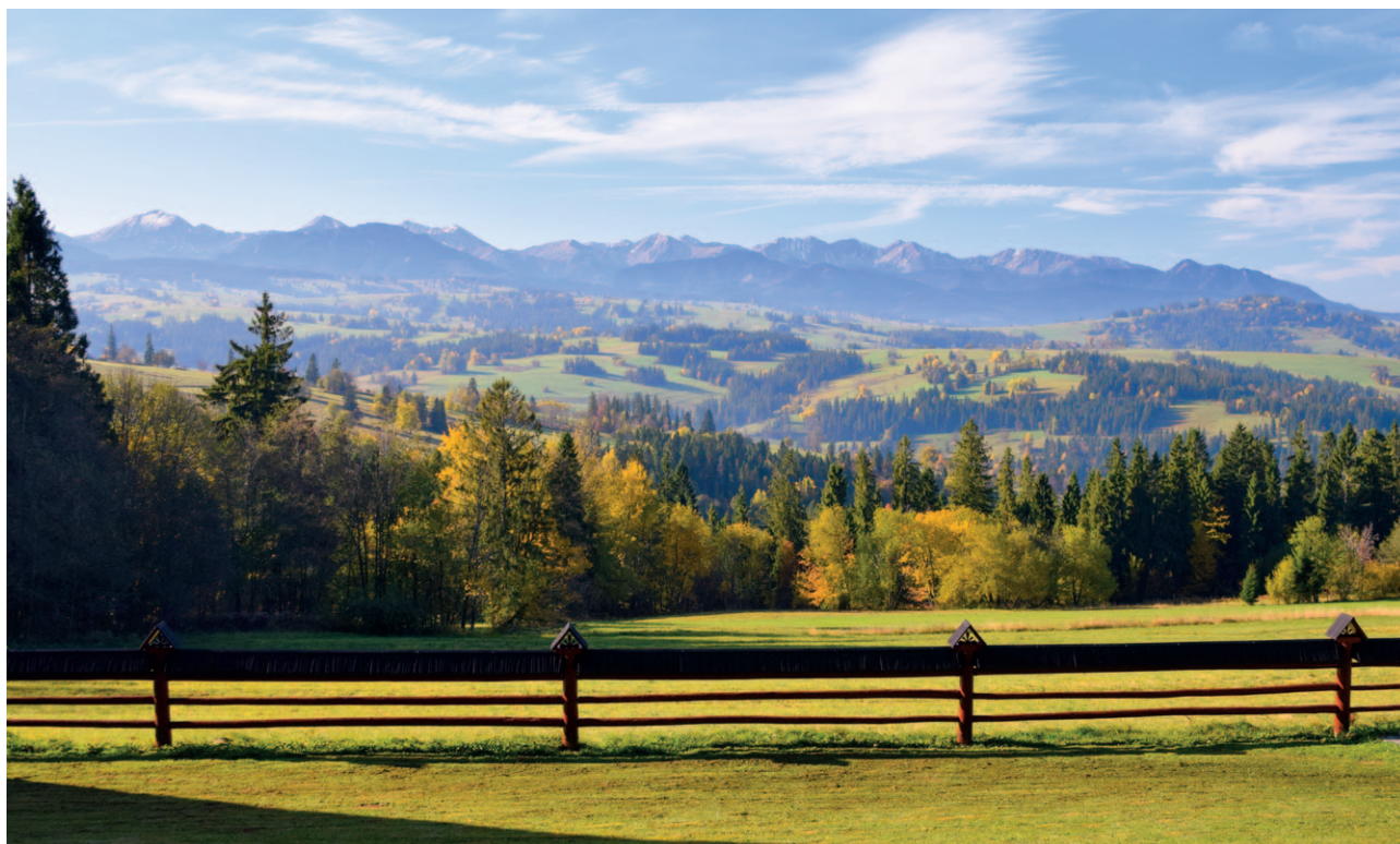
Ryc. 5. Panorama Tatr

elementów krajobrazu, jak na przykład konkretnej alei drzew, zespołu dworskiego z parkiem, tradycyjnego układu pól wstęgowych, panoramy widokowej na sąsiedni krajobraz.