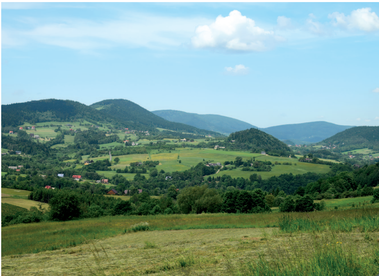
Ryc. 1. Krajobraz Beskidu Wyspowego