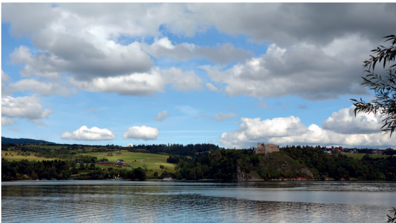
Ryc. 31. Zmiany klimatyczne w ujęciu lokalnym mają ścisły związek ze stosunkami wodnymi