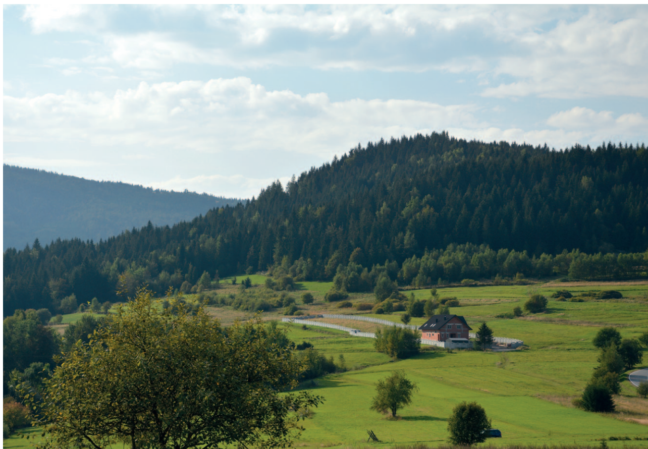
Ryc. 17. To już nie tylko rozproszenie zabudowy, ale nieuzasadniona dewastacja krajobrazu

dla stref ochrony krajobrazowej, wyodrębnionych w granicach parków krajobrazowych transponowane do planów ochrony tych parków). Rekomendacje adresowane do gmin wskażą tereny, w których powinno się ograniczyć zabudowę lub jej zaniechać. W szczególności dotyczy to może terenów stanowiących przedpole lub oś widokową czy też bezpośrednio tło elementu krajobrazowego, wymagającego odpowiedniej ekspozycji. Ograniczenia mogą dotyczyć sytuowania budynków lub dopuszczalnych gabarytów zabudowy tak, aby nie przesłaniała ona widoku na przedmiot ekspozycji. Tylko w wyjątkowych przypadkach audyt będzie zalecał wprowadzenie w planach miejscowych zakazu lokalizowania nowej zabudowy. Rekomendacje wprowadzające tego rodzaju ograniczenia mogą również obejmować tereny, które z samej istoty stanowią ważny komponent krajobrazu priorytetowego. Przykładem takim są m.in. niezabudowane stoki dolin o wyjątkowym znaczeniu dla fizjonomii krajobrazu, tereny niezabudowanych płaszczyzn o szerokiej perspektywie lub szczególnej ekspozycji widokowej albo brzegi zbiorników wodnych. W wielu przypadkach są to obszary, na których za-