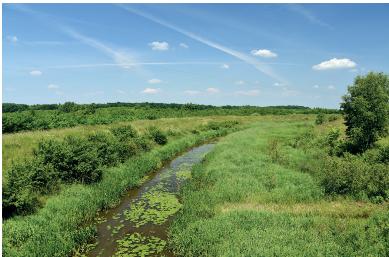
Ryc. 25. Przykład krajobrazu przyrodniczego mającego potencjał do objęcia go ochroną