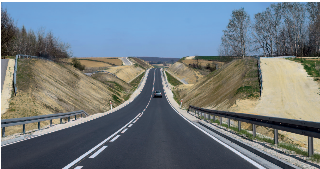
Ryc. 32. Istotny wpływ na dzisiejszy krajobraz ma sposób zaprojektowania inwestycji infrastrukturalnych