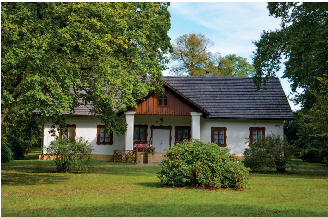
Ryc. 40. Przykład rewitalizacji zabudowy dworskiej