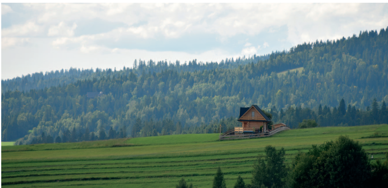
Ryc. 16. Rozpraszanie zabudowy jako istotny element zmian w krajobrazie

jobrazy, w których utrzymuje się wyraźny układ pól, miedz, śródpolnych zadrzewień, potoków; krajobrazy otwarte, stanowiące niezakłócony pejzaż rolniczy, będące często płaszczyznami o dużej i dalekiej ekspozycji widokowej. Dla nich, o ile położone są w obszarach krajobrazów priorytetowych, audyt będzie rekomendował zapobieganie procesowi bezładnego rozpraszania zabudowy. Gminy, przy opracowywaniu dokumentów planistycznych, będą zobowiązane do wskazywania