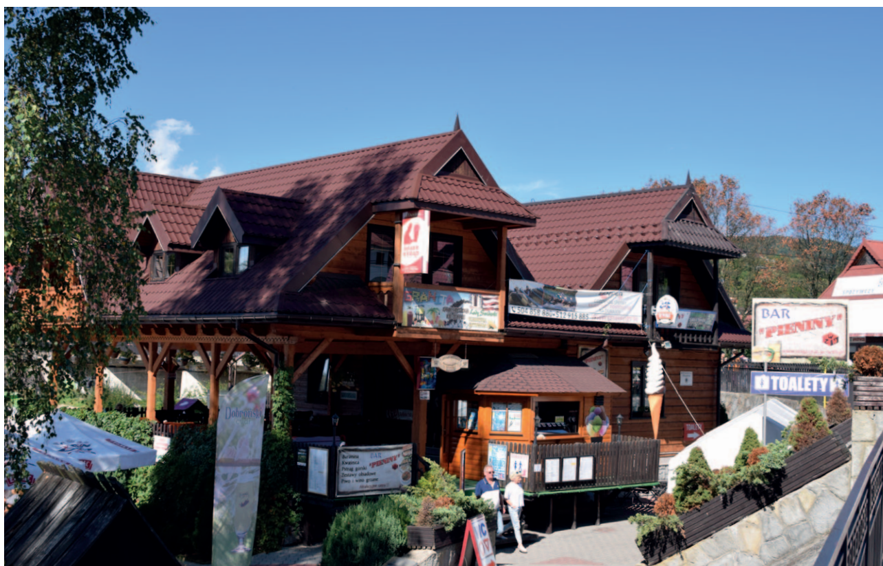
Ryc. 11. Za reklamą ginie piękno architektury

Do decyzji gmin pozostanie doprecyzowanie granic tych obszarów oraz ustalenie szczegółowych regulacji w zakresie dopuszczonym przepisami uoipzp. Opanowanie chaosu reklamowego z natury rzeczy będzie procesem długim, związanym z podnoszeniem kultury biznesu i kultury społeczeństwa. Można jednak i należy pewne zachowania wymuszać, przyspieszać, posługując się zarówno dobrym przykładem i nagradzaniem,