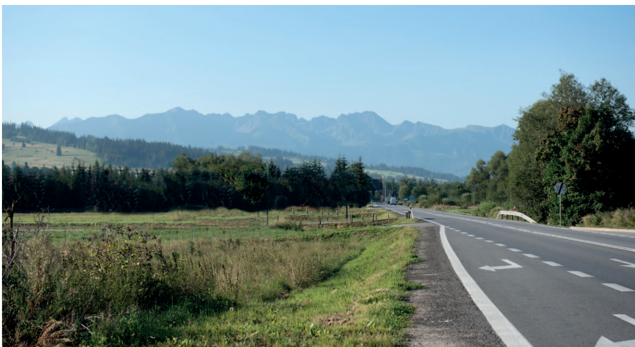
Ryc. 13. Symulacja widoku na Tatry z poprzedniego zdjęcia po usunięciu reklam

jak pewną formą nacisku. Politykę w zakresie eliminacji nadmiaru reklam należy docelowo skoncentrować we wszystkich krajobrazach priorytetowych.