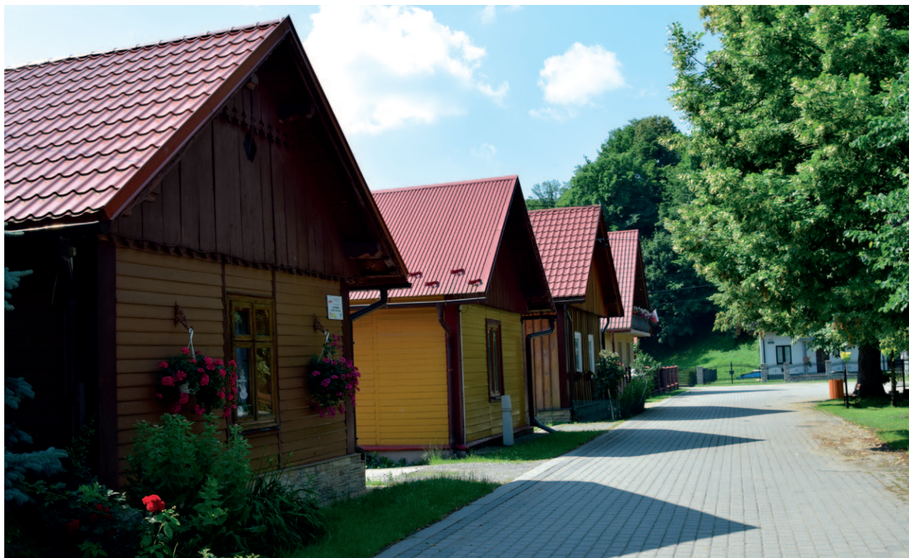
Ryc. 24. Zachowany układ zabudowy w jednej z małopolskich wsi