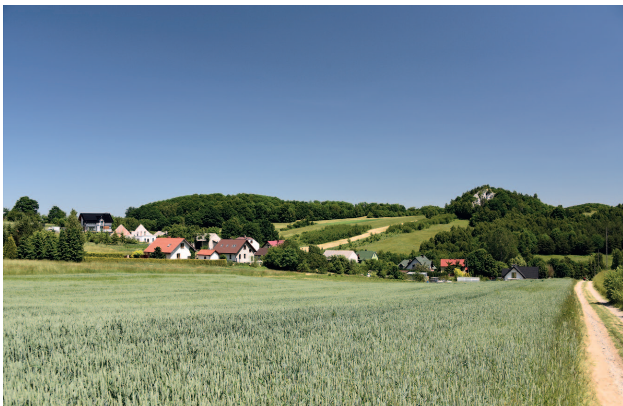
Ryc. 9. Współczesna zabudowa utrzymująca tradycyjny układ przestrzenny w harmonii z krajobrazem

kulturowego; obszarów, w których ze względu na zachowane wartości kulturowo-krajobrazowe, rekomendowane będzie też ustanowienie parku kulturowego lub innej formy ochrony prawnej. Ponieważ wejście w życie audytu krajobrazowego nie skutkuje koniecznością nowelizowania przez gminy ani studium, ani planów miejscowych, ustalenia te staną się dopiero wtedy podstawą wydawania decyzji administracyjnych, gdy gmina zdecyduje się na uchwalenie w tym obszarze nowego planu. Wytyczne audytu w zakresie kształtowania zabudowy, bez opracowania szczegółowych studiów krajobrazowych, mogą dotyczyć tylko niekwestionowanych cech i parametrów. Powinny dawać możliwość rozbudowania i skonkretyzowania odpowiednich ustaleń planu miejscowego po przeprowadzeniu precyzyjnych analiz krajobrazowych oraz po analizie splotu wszystkich innych, ustawowo określonych uwarunkowań. W odniesieniu do realizacji inwestycji w przestrzeni publicznej, wytyczne architektoniczne mogą być pomocne w przełamaniu ograniczeń, jakie niesie prawo zamówień publicznych, wymuszające stosowanie najtańszych rozwiązań, materiałów i technik wykonawczych.