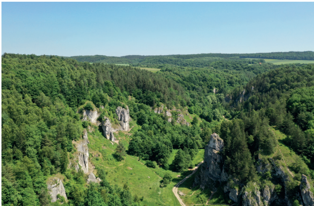
Ryc. 26. Dolina z występującymi formacjami skalnymi w jednym z parków krajobrazowych

kompetencje do uzgadniania projektów uchwał w sprawie utworzenia parku krajobrazowego.