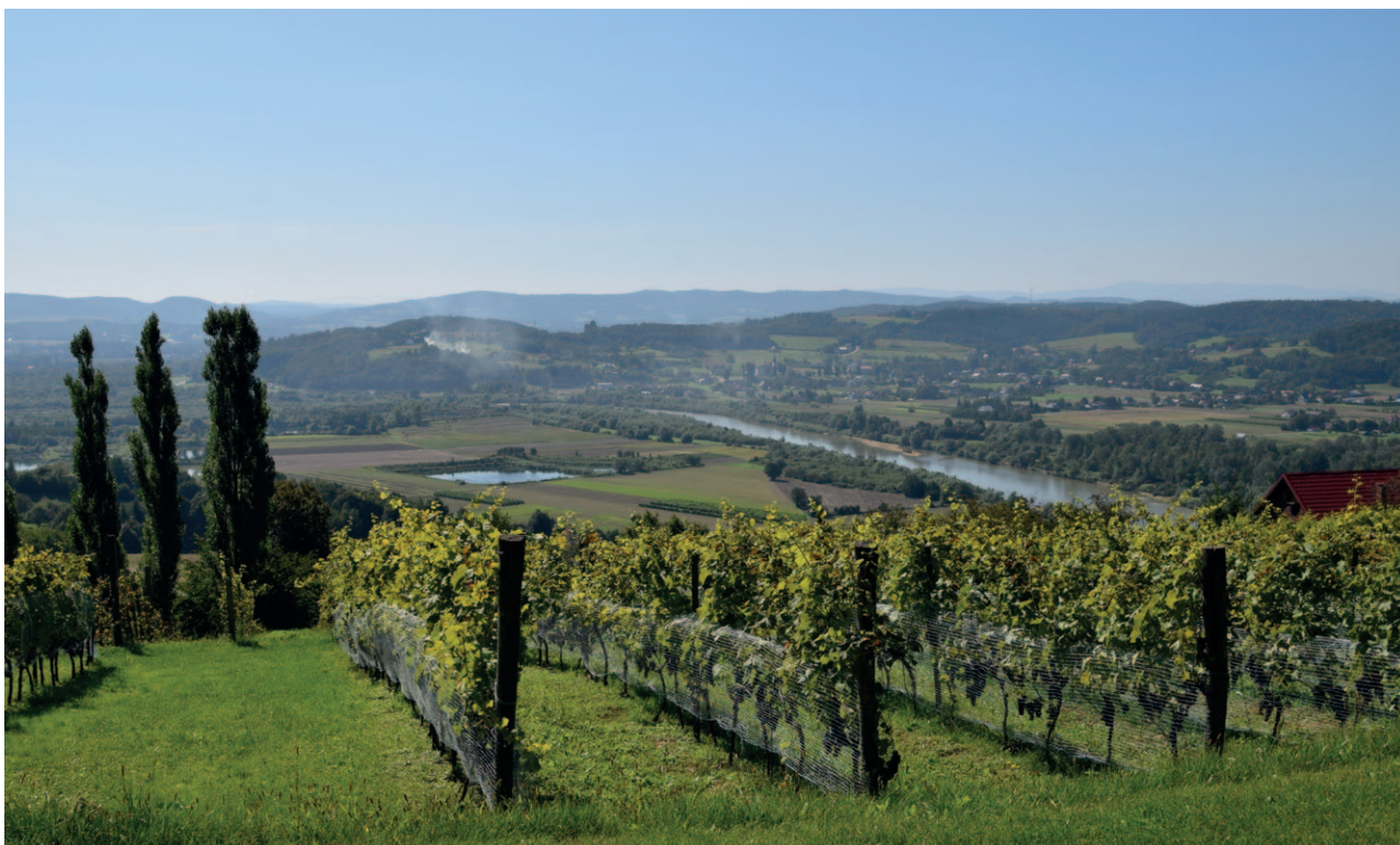
Ryc. 6. Jedna z winnic na zboczach Doliny Dunajca

zadrzewień śródpolnych i alej, opieki nad pomnikami przyrody, odnowy zabytkowych zespołów parkowych, wspieranie nowych założeń zieleni urządzonej mających duże znaczenie w polityce klimatycznej, finansowanie zakładania nowych rezerwatów, parków krajobrazowych, dolesień, etc.