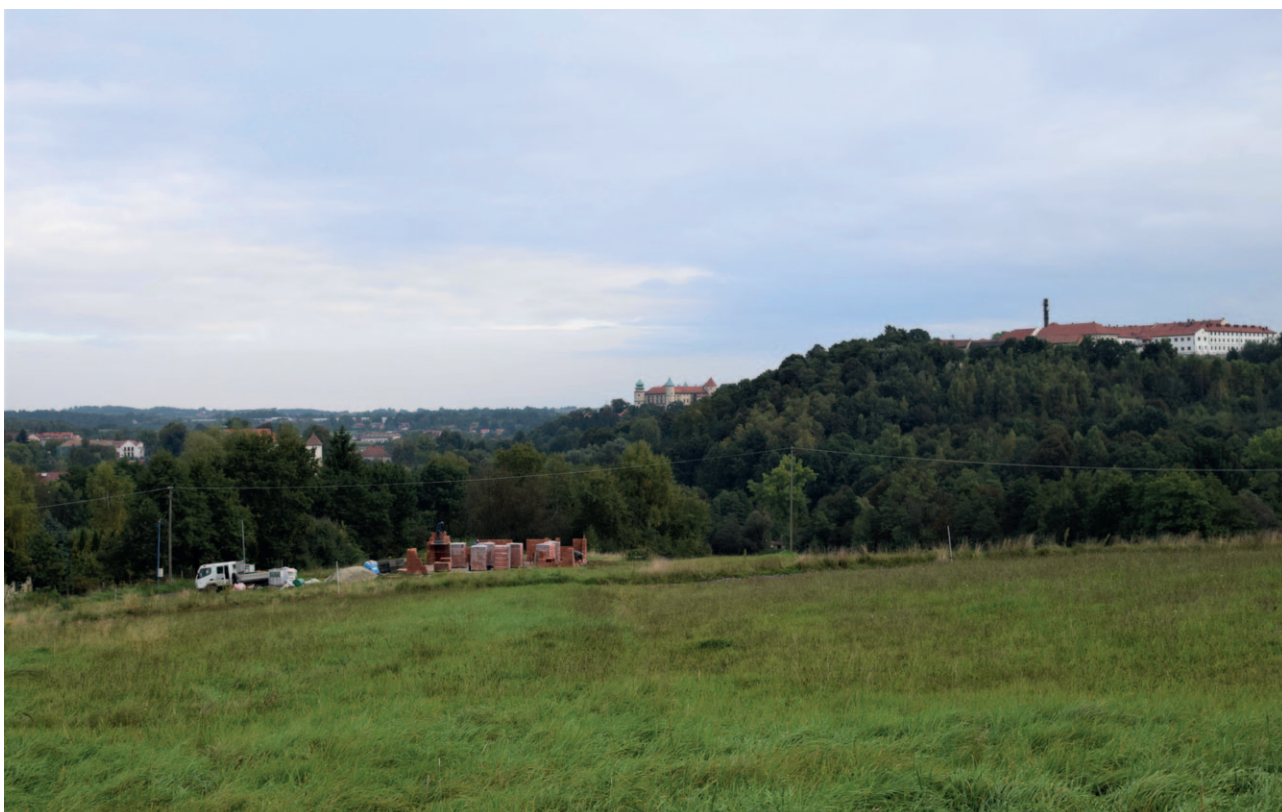
Ryc. 19. Przedpole ekspozycji zabytkowych zespołów architektoniczno-krajobrazowych zagrożone zakłóceniem widoku

sprawiedliwy system żywnościowy. W praktyce oznaczać to będzie m.in. wsparcie drobnych gospodarstw rodzinnych, stosujących ekologiczne sposoby upraw i hodowli, oszczędne gospodaro-