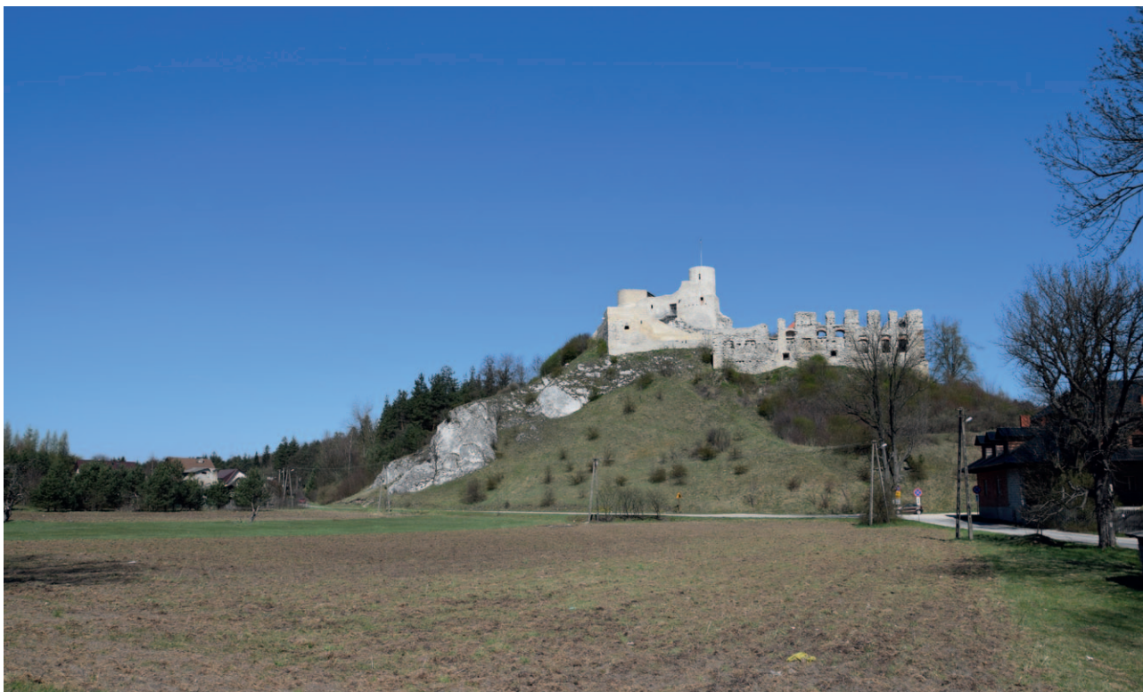
Ryc. 18. Przedpole ekspozycji umożliwiające niezakłócony widok ruin zamku