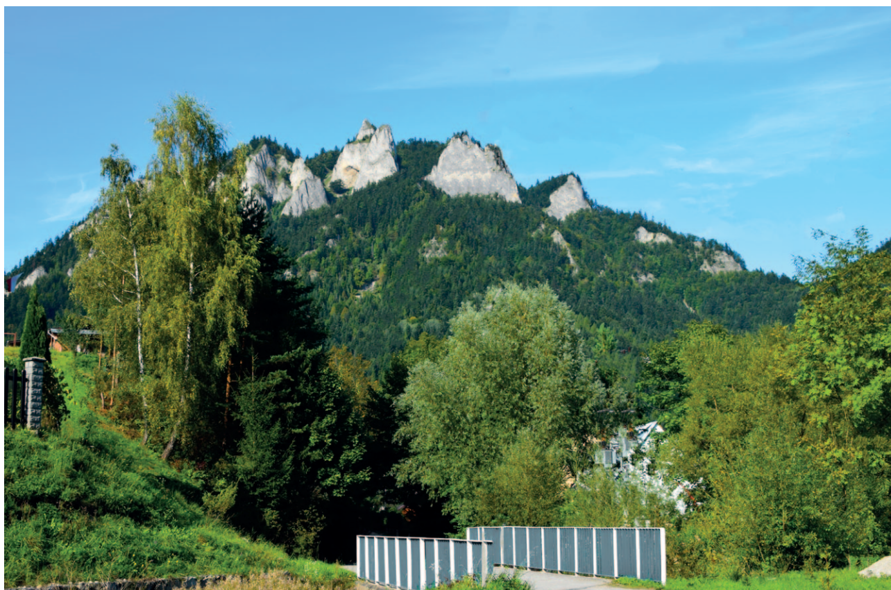
Ryc. 42. Symulacja widoku na Trzy Korony z poprzedniego zdjęcia po usunięciu elementów infrastruktury