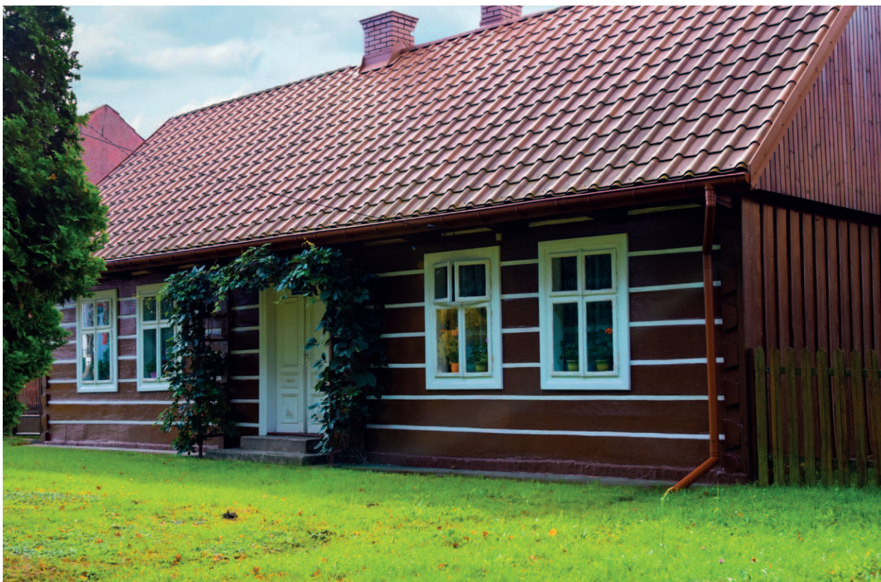
Ryc. 39. Przykład rewitalizacji zabudowy wiejskiej