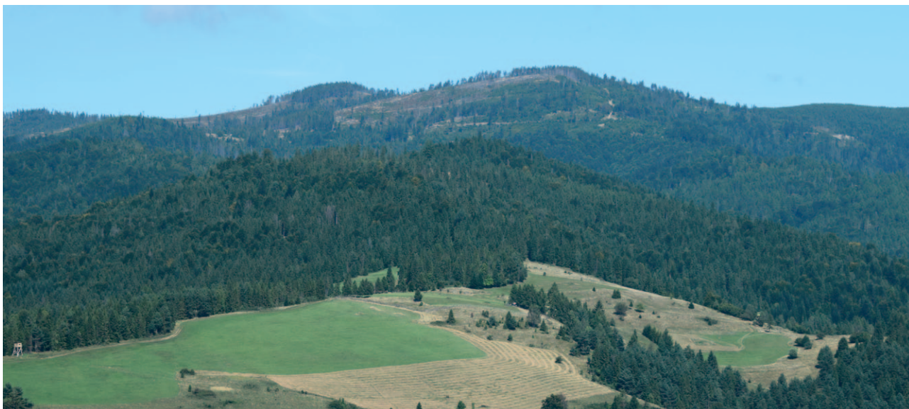
Ryc. 28. Intensywna eksploatacja lasów na jednym z beskidzkich wzgórz