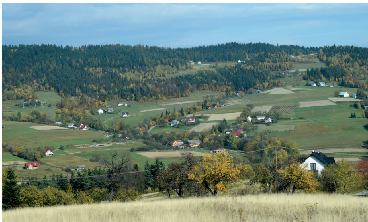
Ryc. 14. Jeden z wielu przykładów rozpraszania współczesnej zabudowy

Istnieją jednak krajobrazy, które z różnych powodów zachowały czytelne struktury osiedleńcze i harmonijne współistnienie zabudowy i upraw rolnych, pasterskich czy sadowniczych. Są to kra-