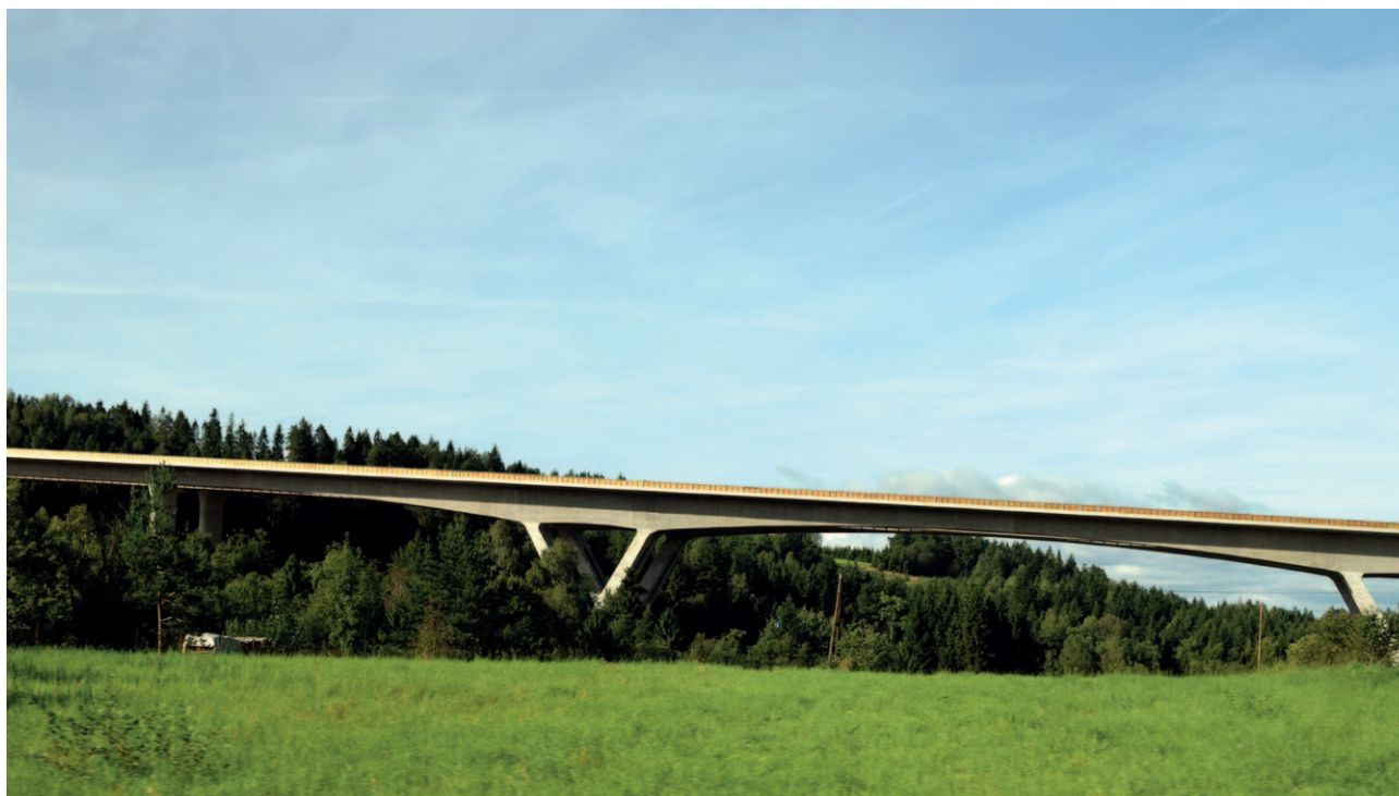
Ryc. 35. Znaczenie dla krajobrazu ma sposób usytuowania infrastruktury technicznej względem powierzchni terenu

niem. Innymi wnioskami dla szeregu krajobrazów, mogą być te dotyczące zaplanowania i realizowania elementów małej retencji. Na pewno do takich działań należy zaliczyć renaturyzację cieków wodnych, wzmocnienie ich ochrony biologicznej, rozwinięcie na dużą skalę zadrzewień i zakrzewień śródpolnych, odtworzenie stawów dworskich i kościelnych, młynówek i lokalnych spiętrzeń, torfowisk i generalnie terenów podmokłych (np. bobrowisk, naturalnych rozlewisk).