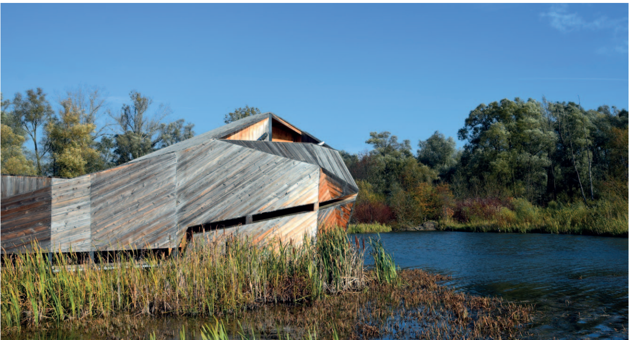
Ryc. 30. Bobrowisko w okolicy Starego Sącza

łań leżą w kompetencjach operatorów lub też administrujących infrastrukturą techniczną jak np. na obszarze Małopolski Tauron S.A. czy Generalna Dyrekcja Dróg Krajowych i Autostrad (GDDKiA) oddział w Krakowie.