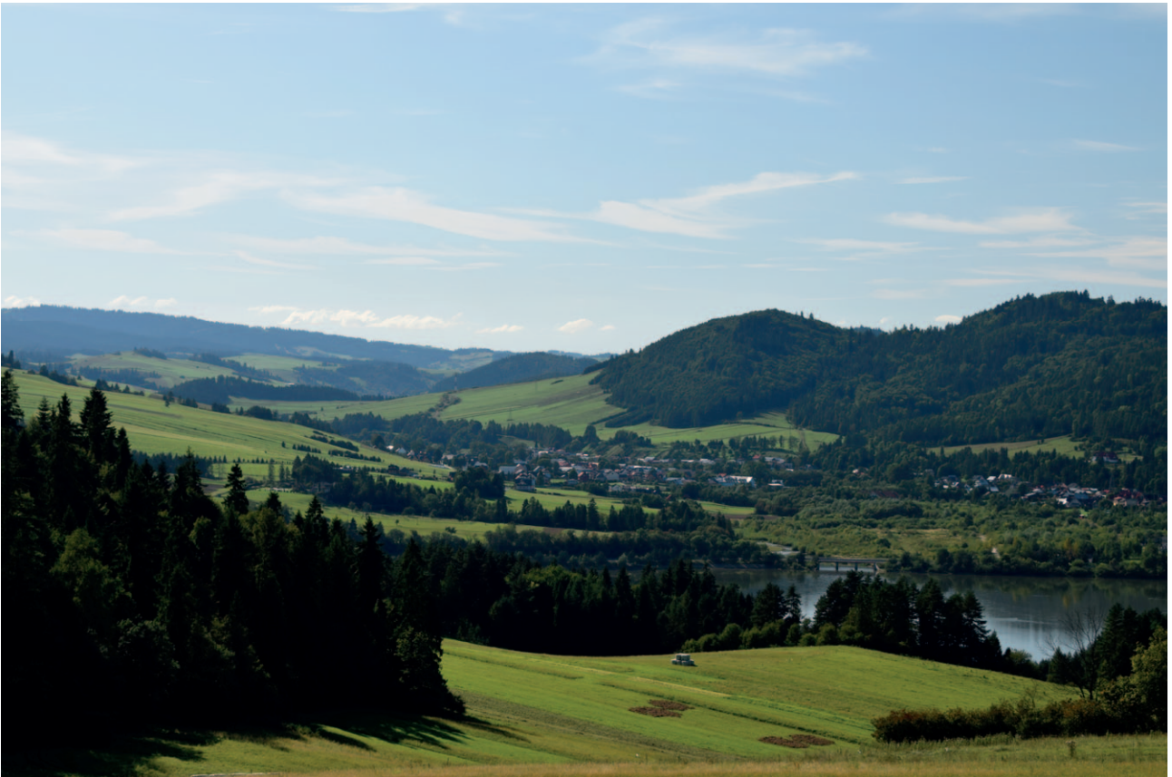
Ryc. 20. Skupiona zabudowa i niezabudowane stoki doliny tworzą uporządkowany, harmonijny krajobraz